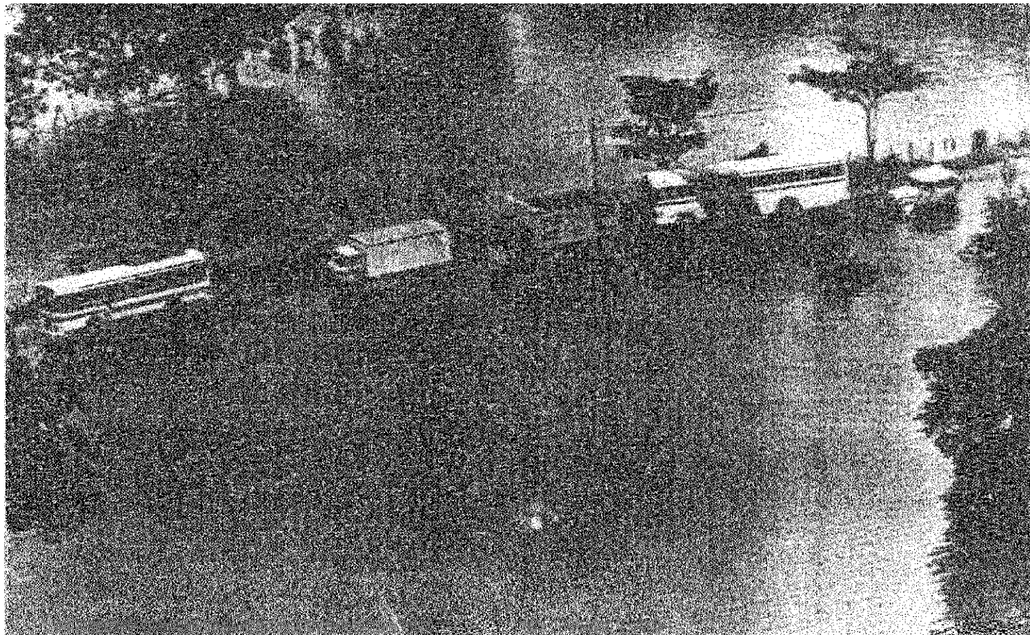
Fotografía 11. Así se mantuvo por varias horas la carretera entre Filadelfia y Santa Cruz, cuando el río Tempisque se desbordó en octubre, 1980.