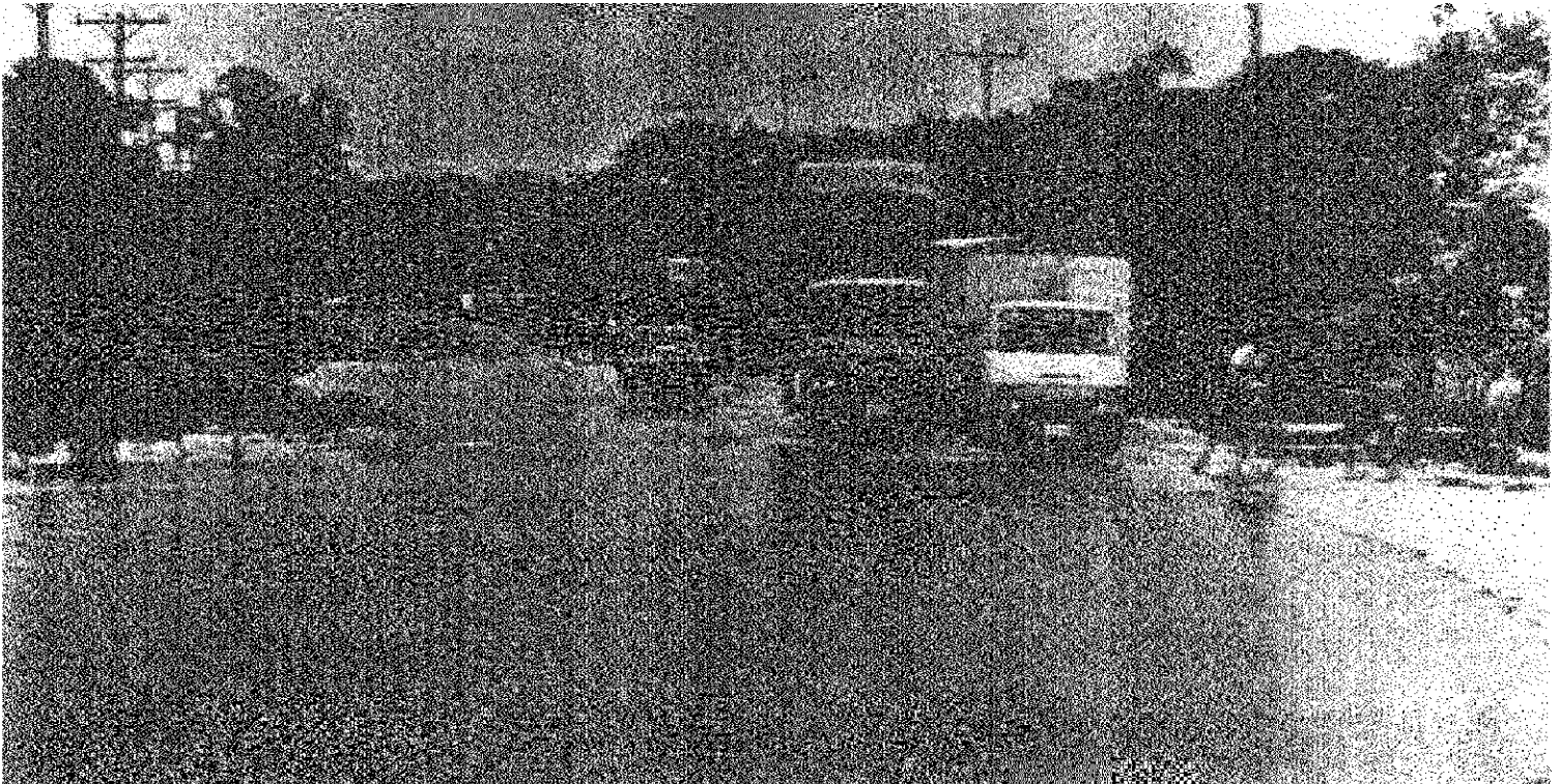
Fotografía 10. El río Tempisque corría libremente por las calles de la ciudad de Filadelfia cuando en el año 1971 se salió de su cauce.

En Filadelfia y Belen las aguas subieron un metro por encima del nivel de la carretera, cuando el río Tempisque se desbordó, inundando La Guinea y toda el área de cultivo que había en sus márgenes.