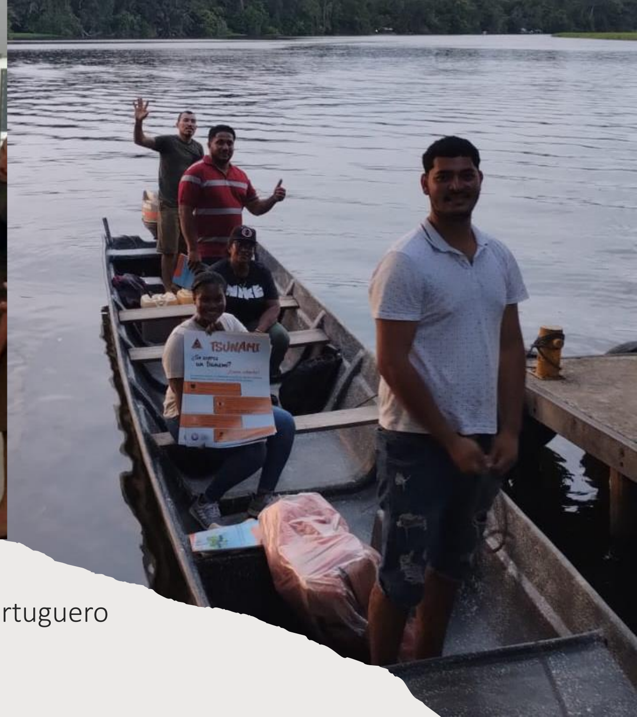
Barras de Colorado, San Fco de Tortuguero y Tortuguero